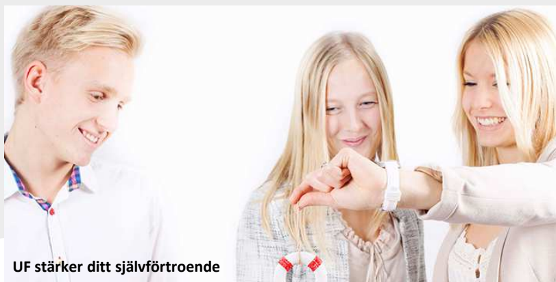
UF stärker ditt självförtroende

Under år 2 och 3 är du på ett fadderföretag. På fadderföretaget tillämpas dina teoretiska kunskaper praktiskt. På fadderföretaget får du chansen att stärka dina entreprenöriella förmågor och din sociala kompetens. Du genomför projekt på riktigt och du kommer även att göra ditt gymnasiearbete på fadderföretaget.